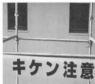
写真19 キケン (危険)