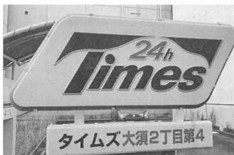
写真7 時間を表す記号①

写真6,7も既存のビデオ教材の内容である「ピクトグラム・記号」に関するもので、時間貸し駐車場の看板であるが、それぞれ「24H」と「24h」が問題になる例である。