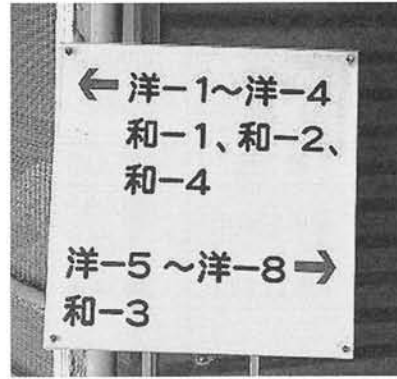
写真2 記号化された文字

例えば、ピクトグラムを例にとると、写真1は河童と市名が書かれているだけのものである 1 。日本国内のピクトグラムには、このように文化的知識を必要とし、外国人には理解しにくいものがある。河童は幼児絵本や児童書でも物語が描かれており、日本人にとっては身近な存在、つまり日本文化である。そして、この河童を水辺に描くことによって「河童が住んでいるかもしれないこの池・川・湖・防火水槽などに近づくことと怖いぞ、いたずらされるかもしれないぞ、引きずり込まれるかもしれないぞ（→だから近づくな）」と、特に子供に伝えたいのであろう。当然、このピクトグラムそのものや、河童が水辺に描かれる理由は、背景が共有できないので外国人には分かりにくい例と言える。