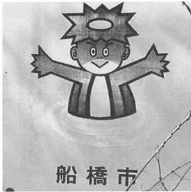
写真1 ピクトグラム

れまでに公開してきた内容を改変することで、初級レベルのユニットが部分的に制作可能となることが分かる。