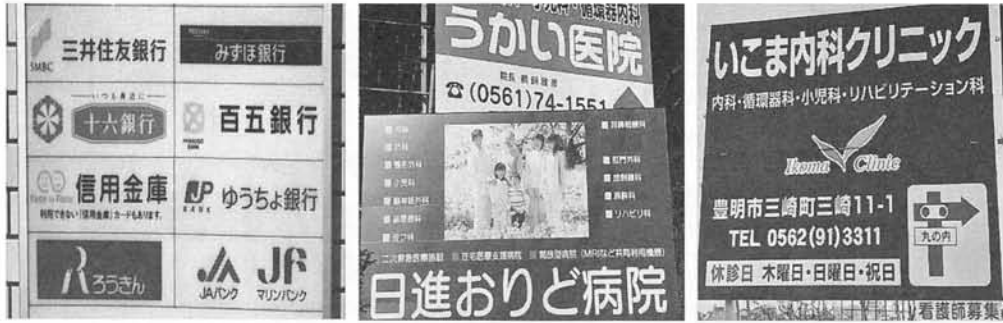
写真 11 語彙のバリエーション① 写真 12 同②