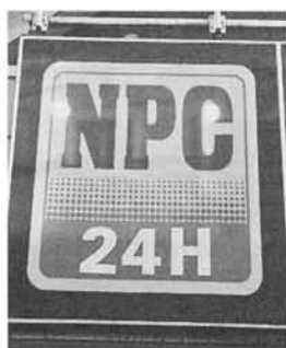
写真6 時間を表す記号②

まず、世界で共通するピクトグラムは、空港をはじめとする外国人が利用する公共の場所（トイレや通路、食事をする場所など）をイメージすると分かりやすい。一方で、日本独自のピクトグラムを考えた場合、例えば温泉を示すピクトグラム（写真3）は、外国人が湯気を料理の湯気と考えてしまい、温かい料理を出すところなどと間違える例が従来から有名である（オリンピック・パラリンピック東京大会や大阪・関西万国博覧会など国際的なイベントを控える中で、経済産業省の産業技術環境局国際標準課が案内用図記号の JIS 改正の検討を開始している）。その他にも高速道路にある「イノシシ」「タヌキ」（写真4,5）など日本に多い動物のピクトグラムも、それを見た外国人の国にいないれば分かりにくいだろう。イノシシの場合は、写真4のように公園や歩道、大学のキャンパスなど、どこでも見かけるものであり、遭遇した場合に「襲ってくる危険性」もあることから掲示されている言語景観である。その意味では、「飛び出してくる可能性」から、主に車道の公共表示として見られる言語景観である「タヌキ」、「キツネ」「トリ」「サル」などは、意味合いが異なる。