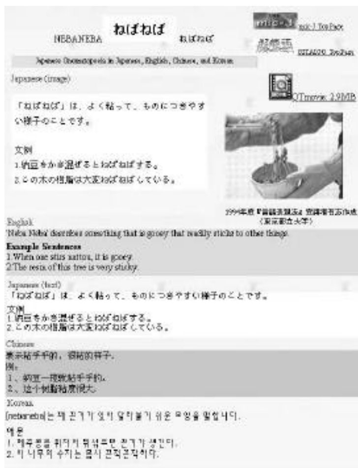
図-4. mic-j 「擬態語」の素材例

WEBに掲載している擬態語は表-2に示した語である。日本語教育学関係の学部生のプロジェクトワークとして、動画と音声を作成し、さらに、各種辞書の記述と議論を