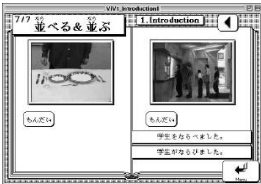
図-5. 自動詞と他動詞のビデオスキット（『日本語玉手箱』より）

各日本語教育機関では、自他動詞についてさまざまな導入法が試みられているが、本WEBでは、その中の一つ、言語文化研究所制作のCD-ROM教材『日本語玉手箱』（1999）収録の自動詞・他動詞のビデオスキットの一部分を公開する 4 。この教材では、動作を表す動画をもとにして自他の動詞の違いを導入し、短編のドラマを通じて豊富な練習ができる。教材設計も学習者とメディアのインタラクティブ性がとられたものになっている。WEBで公開するのはごく一部で、導入用動画の部分だけである。対立のある自動詞と他動詞を並列提示し、動画を用いて概念を伝え、その音声と文字表記を覚えること、つまり弁別学習と連合学習、動画による直接指示により記憶を効率的に行おうとするものである（下記図-5 参照）。対象となる自動詞と他動詞は「あける／あく」「だす／でる」「いれる／はいる」「けす／きえる」「ならべる／ならぶ」「しめる／しまる」「つける／つく」の7対14動詞で、それぞれの動詞を示す動作や状況のビデオスキット42からなっている。